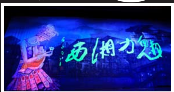
一场必看的民俗表演