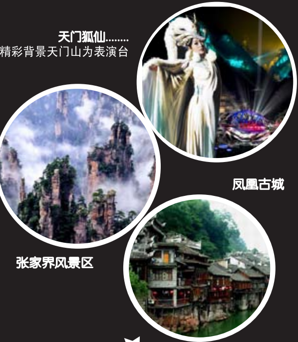
天门狐仙..... 精彩背景天门山为表演台